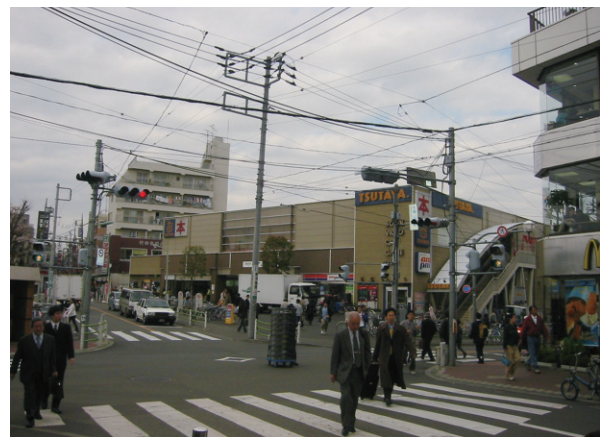
現在の大岡山駅前：踏切も、やぶももうありません。角のロータリー跡のマクドナルドはいつも大繁盛.