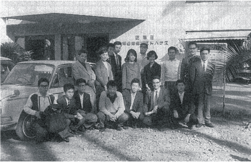
学科設立当時の教室旅行 (東工大百周年記念誌より)