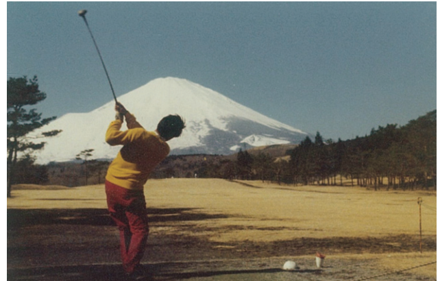
ナイスショット!! 教室ゴルフコンペ (1976) この豪快なスイングと派手なウエアは??