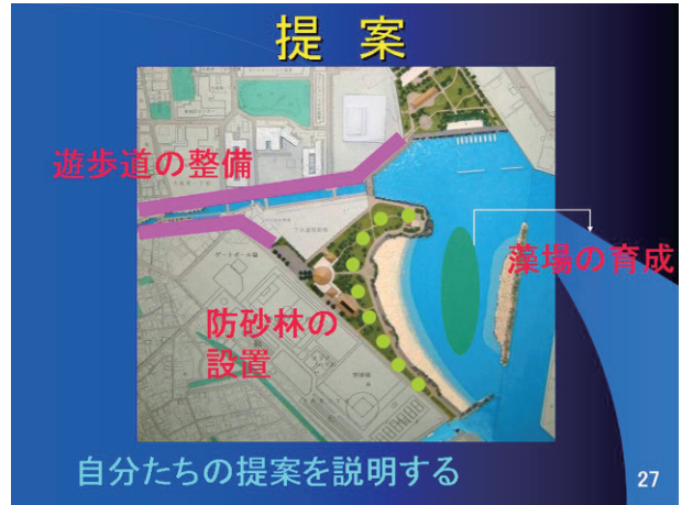
「環境と調和した町づくり」-大森ふるさとの浜辺-発表スライド