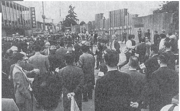
昭和44年7月 大学封鎖解除（東工大百年史より） 駅前の銀行がまだ「日本勧業銀行」