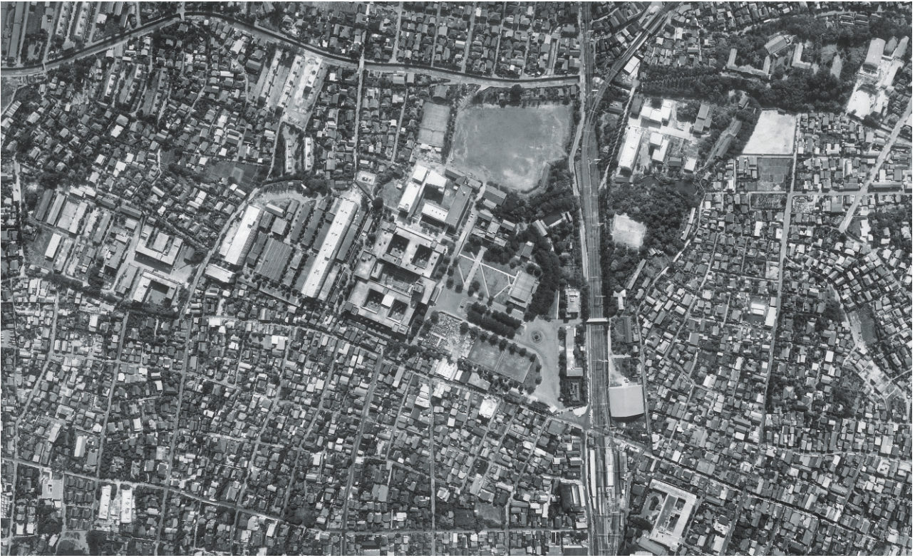
大岡山キャンパス航空写真（昭和41年6月）当時緑が丘には学生寮しかなかった。