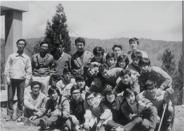
木崎湖研修所の測量合宿（5期）