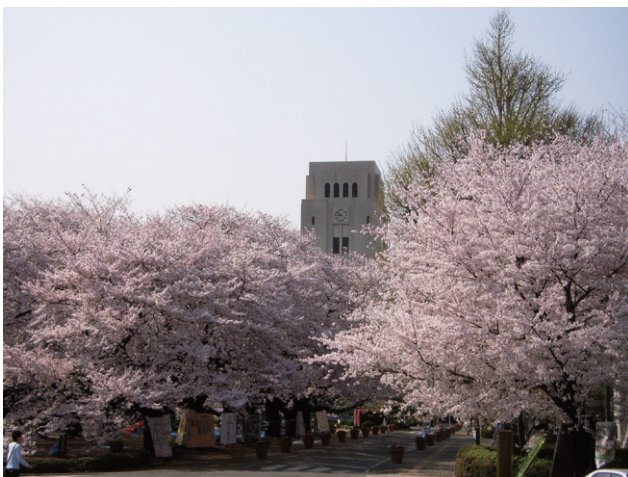
本館と桜：これは今も変わりません (2005. 4撮)