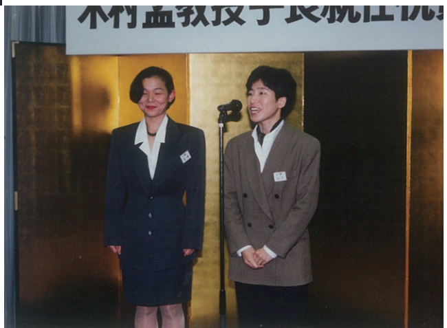
土木最初の女子卒業生二人もお祝いに駆けつけました。