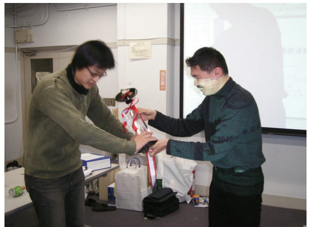
藤井先生からトロフィーの授与