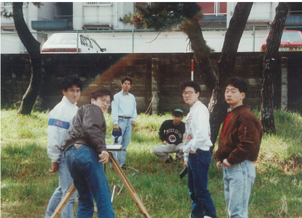
ついカメラ目線, いけない三脚蹴飛ばしちゃった.