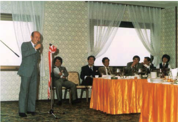
助手OB会（1983年）