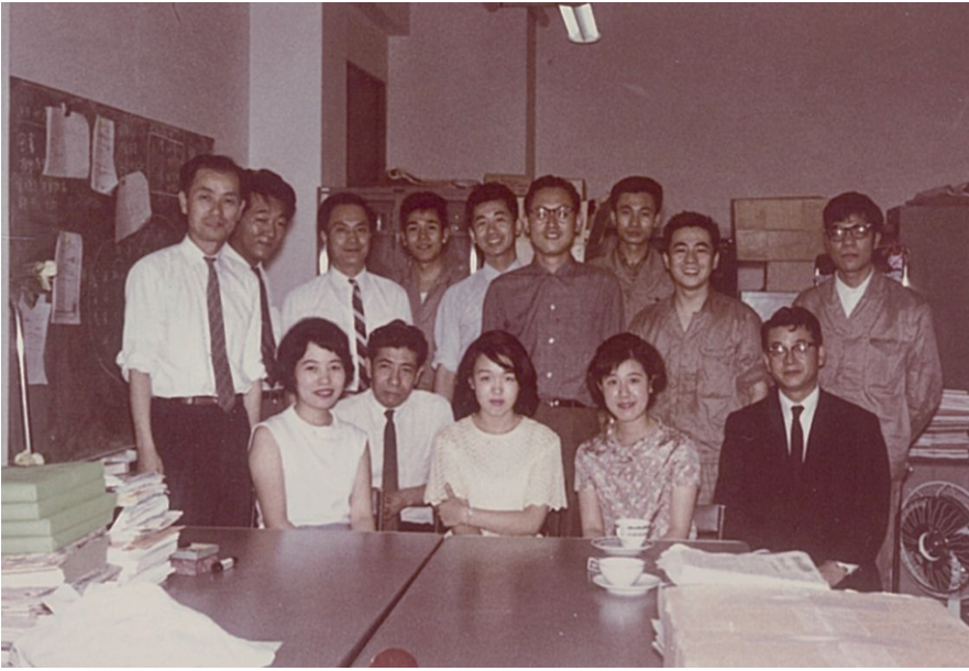
学科設立当時のスタッフ どなたかわかりますか？