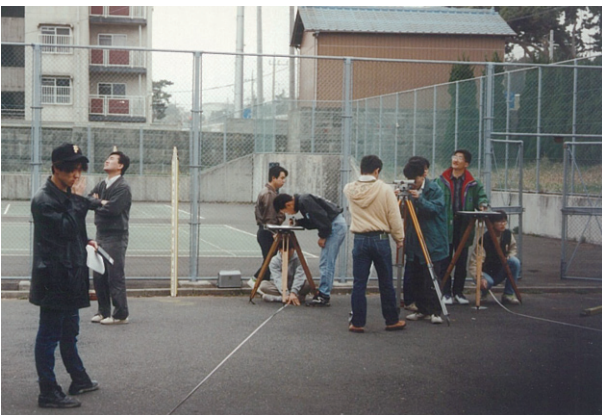
まずい, もうみんな平板してる. このレベル, 気合いで閉合比合わせるぜ:大洗の測量実習(27期)