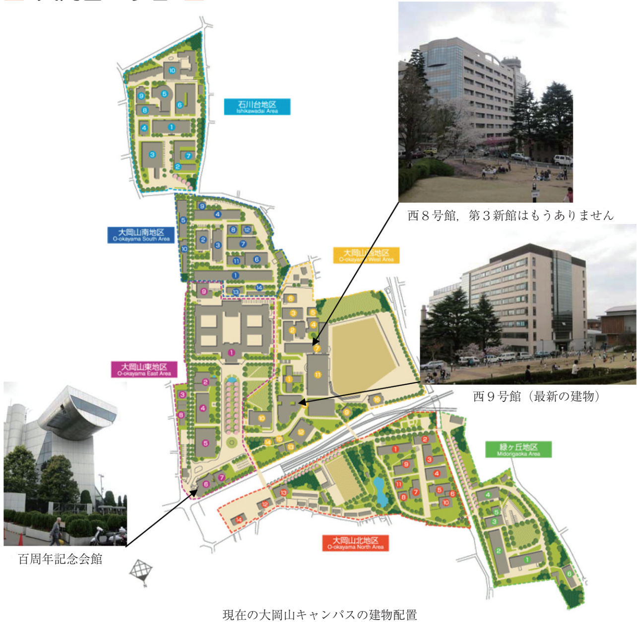
現在の大岡山キャンパスの建物配置