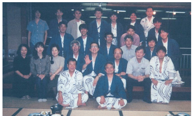
教室旅行 (1998年 箱根)