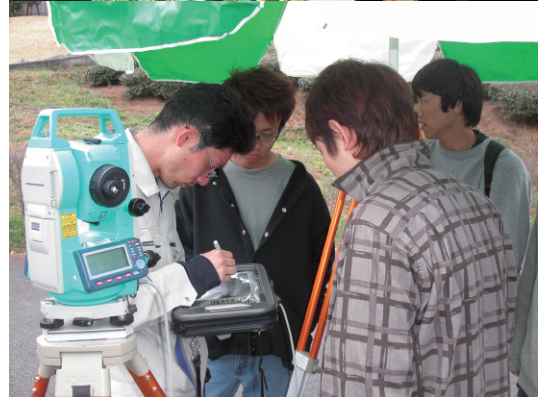
現在の測量合宿：トータルステーションでばかりです.