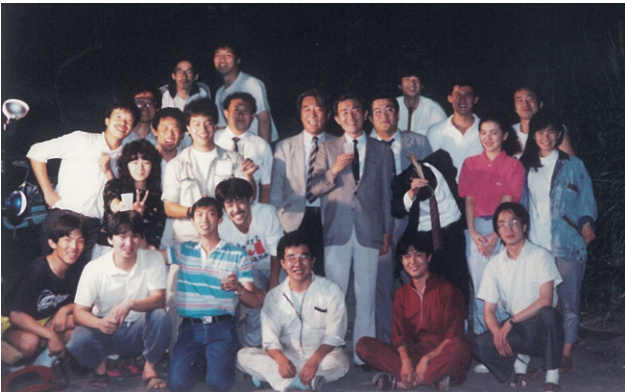
土質研恒例夏のバーベキューパーティー（1988）