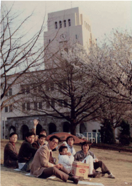
構造研花見：昭和52年春