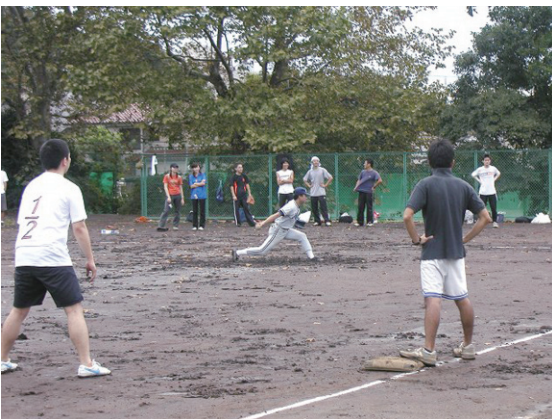
助手会主催のソフトボール大会

今は色々な研究室でやっています。一番大きいのが、コンクリート&土質研主催の夏の学生実験打ち上げパーティー、この飲みっぷりはコンクリートの伝統？