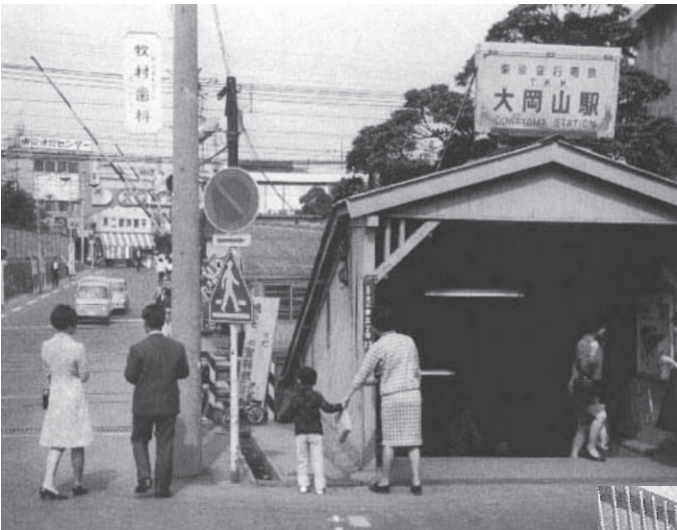
昭和42年の大岡山駅 （東京に消えた街角，加藤嶺夫，河出書房新社）