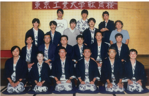
教室旅行 (1987年 伊香保温泉)