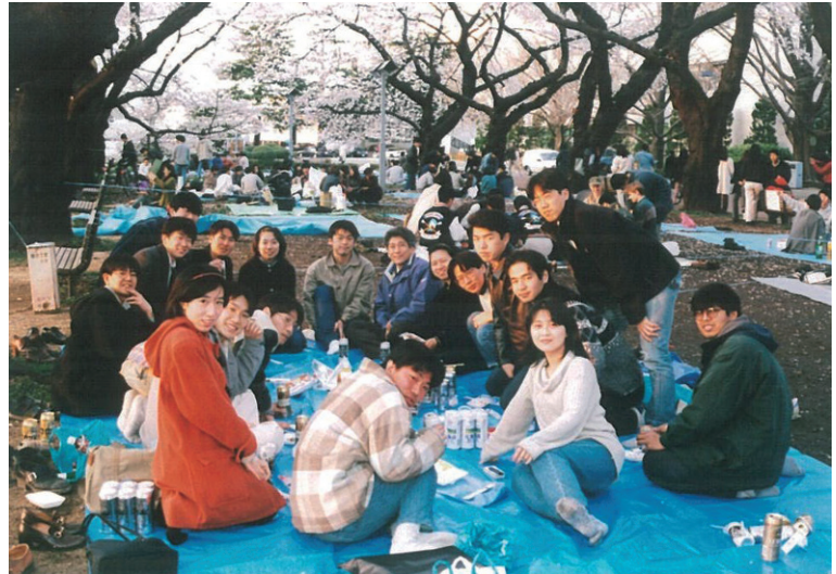
本館前の桜並木での土質研花見（平成10年）